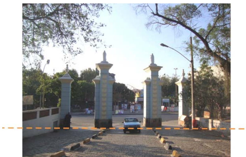
Figura 6: Limite Irmandade

Existe no tecido urbano da Penha a distinção clara entre o público e o privado, estando seu limite nos alinhamentos das edificações que definem as quadras. No entanto, esse dado passa a ser menos importante do que a dominância do espaço coletivo, representado por toda a área livre da Irmandade e do Santuário. É esse espaço, de propriedade privada e uso público, o que mais fortemente caracteriza a área de estudo (fig. 06).